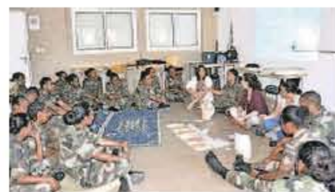
L'atelier « Contraception » a permis d'aborder avec les volontaires stagiaires le cycle menstruel et les différents moyens de contraception.