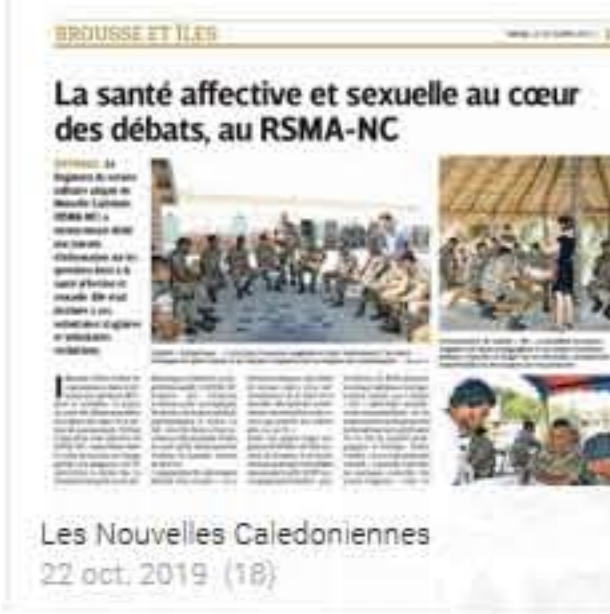
Les Nouvelles Calédoniennes 22 oct. 2019 (18)