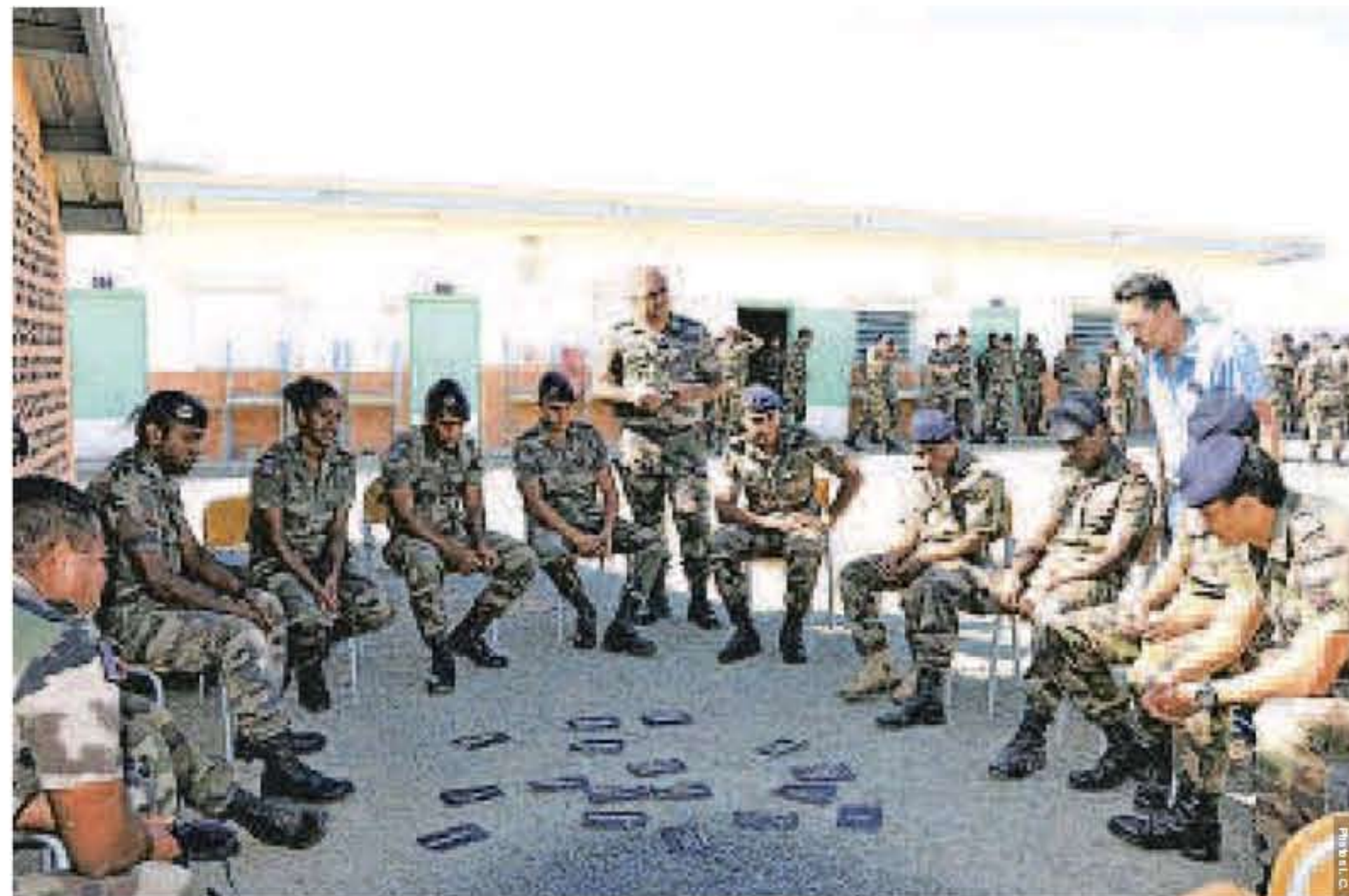
L'atelier « Il paraît que... » a été, pour les jeunes stagiaires et pour l'intervenant, l'occasion d'évoquer les idées reçues et les fausses croyances sur les moyens de contraception.

Informé et faire évoluer les connaissances dans le domaine des relations affectives et sexuelles. Et placer au coeur des débats la question du respect de l'autre et la notion de consentement. Tel était l'objectif de cette initiative du RSMA-NC, intervenant dans le cadre de la prise en charge globale des stagiaires sur les savoir-faire et savoir être. La formation intégrait aussi l'apprentissage de la citoyenneté, le suivi médical et des actions collectives de prévention et d'information. Une journée qui n'était pas sans en rappeler une précédente, organisée en mai, au cours de laquelle les jeunes du