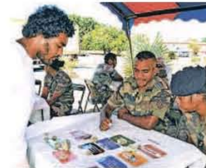
A l'atelier Solidarité SIDA, il a été question de la santé sexuelle et affective et du dépistage de VIH, d'aide et d'accompagnement au travers d'entretiens et d'activités ludiques.

« Cette journée est capitale puisqu'il y a vraiment une lacune en termes de