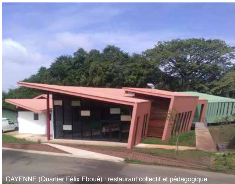
CAYENNE (Quartier Félix Eboué) : restaurant collectif et pédagogique

En 2019, un peu plus de 12,6 M€ ont été engagés afin de procéder à des créations, rénovations ou modifications d'infrastructures, notamment :